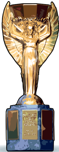
Кубок Жюля Римэ Из серебра с позолотой Вес: 3,8 кг Высота: 35 см

Первый приз Золотую богиню Нику навечно передали Бразилии, у которой трофей украли. Нынешний кубок планируют вручать до 2038 года, пока на его основании будет место для надписей команд-победительниц.