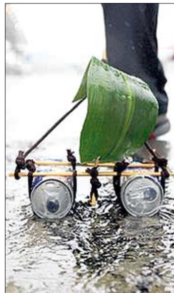
Снова «быки». Попутного ветра