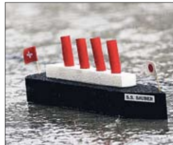
«Заубер». Швейцарская мощь