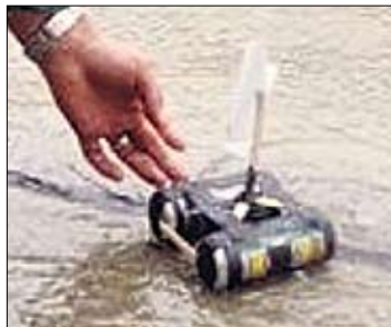
«Лотус». Скромненько, как всегда