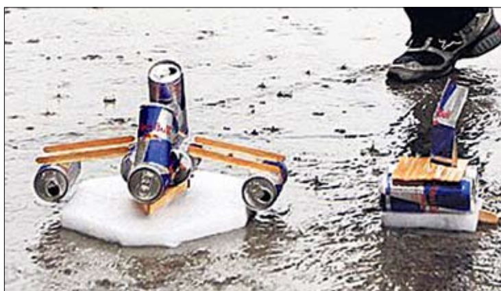
«Ред Булл». И плавают, и побеждают «быки» вместе

Тем временем босс Ф-1 Берни Экклстоун уверяет, что для проведения ГП в России не хватает лишь подписи премьер-министра Владимира Путина. Согласно проекту, этап пройдет в 2014 году в Сочи, стоимость строительства автодрома — 200 млн евро.