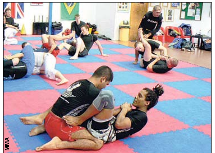
Тренировка. Основной упор — на борцовские приемы и броски

Однако в большинстве случаев бойцы для ММА сознательно тренируются с тренерами различных стилей под эгидой одного бойцовского клуба, пытаясь подготовиться к встрече с любимым противником. Соответственно, стандартная тренировка включает в себя довольно