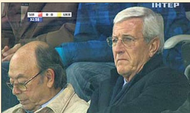
Липпи в Женеве присматривается к сборной Украины

► Во время матча Швейцария — Украина камера нашла на трибунах Липпи. Внимательно смотрел, что-то обсуждал. Ушел за десять минут до финального свистка. Авторитетная La Gazzetta dello Sport пишет, что Липпи встречался с Григорием Суркисом, который сделал тренеру «серьезное предложение». В ближайшее время Марчелло даст главе ФФУ ответ. Хотя Суркис встречу с итальянцем отрицает, просочилась информация, что он выдвинул Липпи условие не меньше, чем 182 дня в год находиться в Украине. В пользу Украины может сыграть то, что Липпи много почерпнул от идей Лобановского, за работой которого следил с начала 80-х. Марчелло не раз с уважением отзывался о нем. А обыграв 4:1 в 1/4 ЛЧ-98, признал: «Чтобы победить Лобановс-