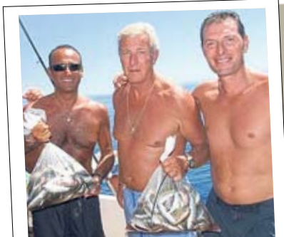
Дома любит порыбачить