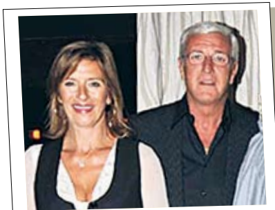
Жену нашел в фан-клубе врагов