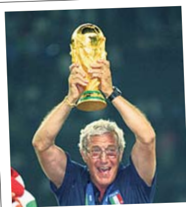
Не проигрывал со сборной 31 матч

ЧЕРНО-БЕЛЫЕ ПОЛОСЫ. В борьбе за талантливого наставника «Юве» обскакал «Милан». Отец Липпи не дождался назначения сына тренером «Ювентуса». Он-то всю жизнь был социалистом и не любил команду «Фиата», считая ее символом власти и капитализма. Марчелло тоже не был чужд левых взглядов, но было бы странно, если бы такой импозантный синьор с сигарой не нашел общий язык с семьей Аньелли. «Рядом с Липпи большинство из нас похоже на Дракулу», — отзывался о его внешности и манерах сэр Алекс Фергюсон. В Турине Марчелло сходу берет скудетто, прервавшее гегемонию «Милана» и первое для «Юве» со времен Платини. В 1996-м — выиграл ЛЧ, Суперкубок, Интерконтинентальный кубок. Липпи ввел моду на «4—2—3—1», хотя его считают больше мотиватором, нежели тактиком. Обратная сторона — конфликты с игроками. В «Юве» у Липпи не заладилось с Баджо, которому тренер предпочитал молодого дель Пьеро. «Он использовал против меня всю власть, точил, как вода камень», — вспоминал Робби. Другая версия: футболист отказался стучать на партнеров, и тренер стал его выживать. В «Интере», который Липпи возглавлял год с небольшим, он конфликтовал с Пануччи. В одном матче Кристиан даже отказался выходить на поле. Годами позже Липпи отомстил, не взяв ветерана на ЧМ-2006... После года в «Интере» и года простоя Липпи вернулся в «Юве». Триумфально — за три года выиграл еще три скудетто!