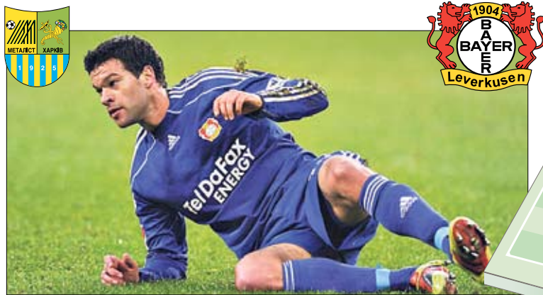
34-летний Баллак. Из-за травм больше отдыхает, чем играет