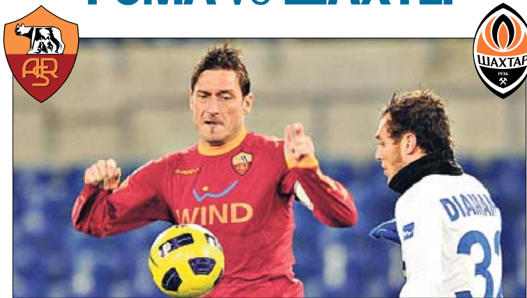
34-летний Тотти. Мегарекордсмен «Ромы» не забивал с игры с ноября