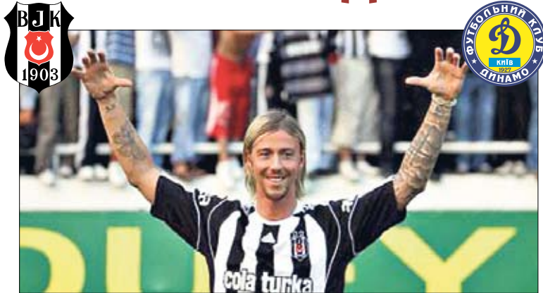
34-летний Гути. «Бешикташ» — лишь вторая команда в карьере испанца