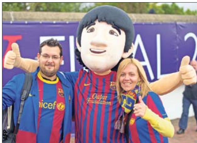
Мессия. Фигурки перед «Уэмбли» были похожи на южноамериканцев, но не на Лео. Радость континента...