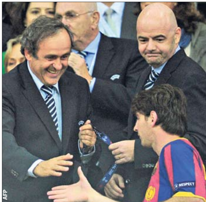
Момент истины. Платини вручает медаль Месси, аргентинец не рад президенту УЕФА, сухое «да, спасибо»