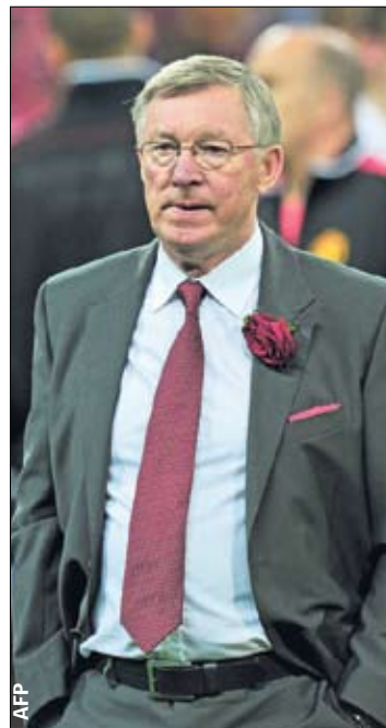
Роза Ферги. Символ Англии — расчет на нейтральных фанов