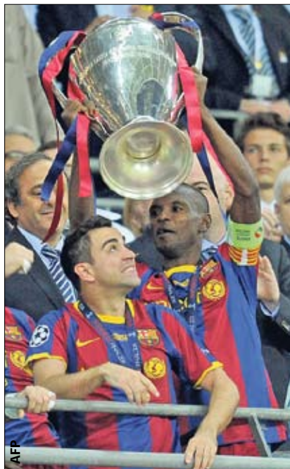
Хави, Чави, Щави. Не бейте его по голове — там гениальность «Барсы»!