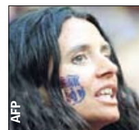
Лого «Барсы». Удар щечкой