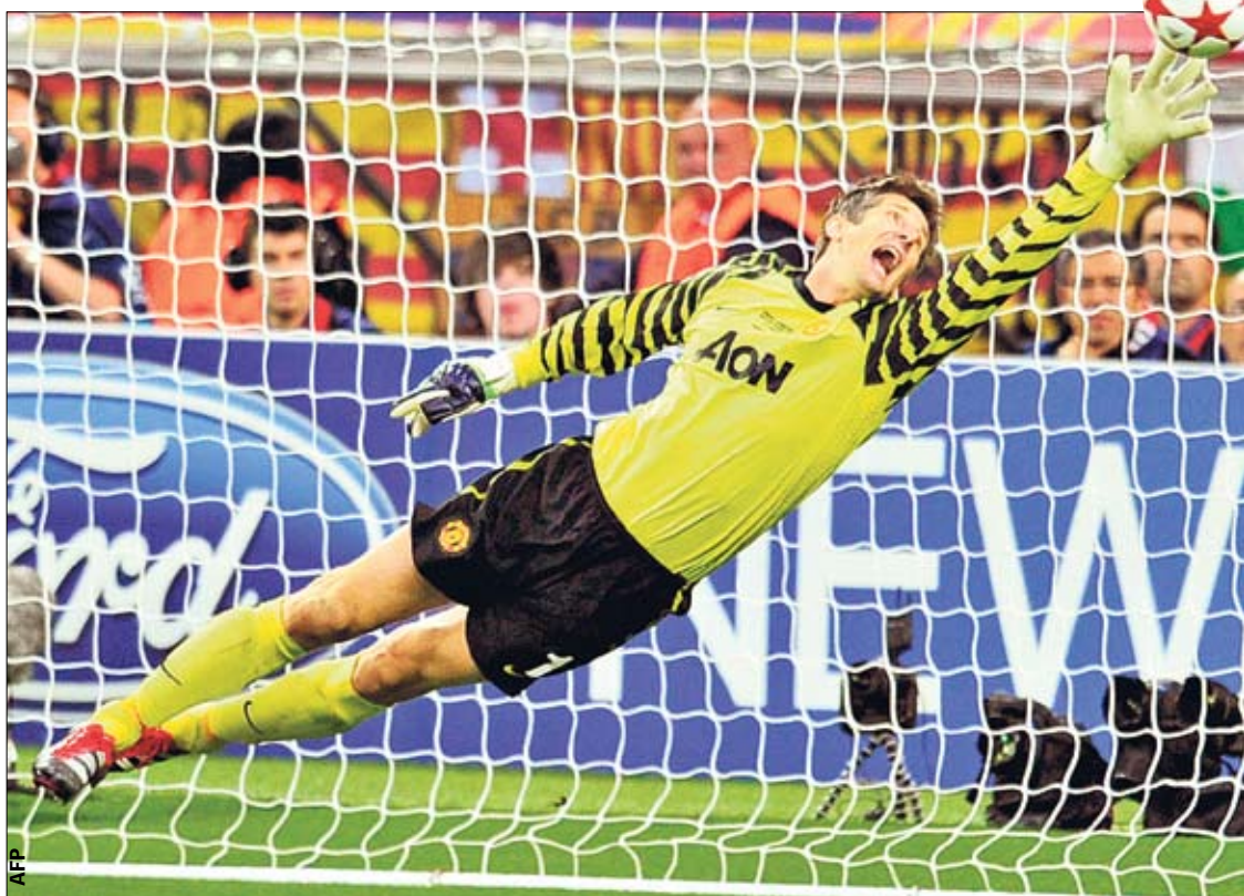
Прощай, Сар! Вратарь «МЮ» красиво ушел из футбола — благодаря красивым голам «Барсы»