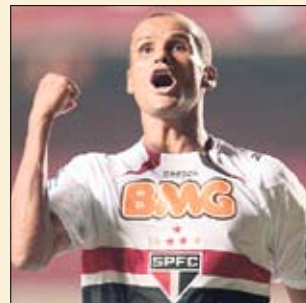
Самый старый — Ривалдо

39 лет Играет за бразильский «Сан-Паулу». 3 выхода на замену (0 голов) в пяти матчах команды-лидера чемпионата.