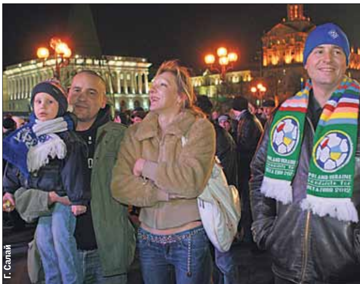
На Майдане. Фаны: «В нашей группе команды по силам равны»

На экране начали разыгрывать сборные по группам и на Майдане все замолчали. Первыми нашими соперниками стали французы — площадь недовольно загудела.