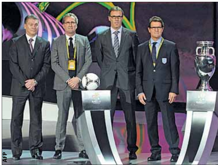
Наша группа D. Тренера Блохин, Хамрен, Блан и Капелло

сию. Один из медиков, парень лет 25-ти, признался «Сегодня»: «Хотим, чтобы жеребьевка прошла в приятной спокойной обстановке». «Чтобы в одну группу не попали Украина и Россия, а то многие схватятся за валидол?» — наш вопрос врачу. «Нет, ну почему же. Если бы Украина и Россия играли между собой, было бы очень хорошо».