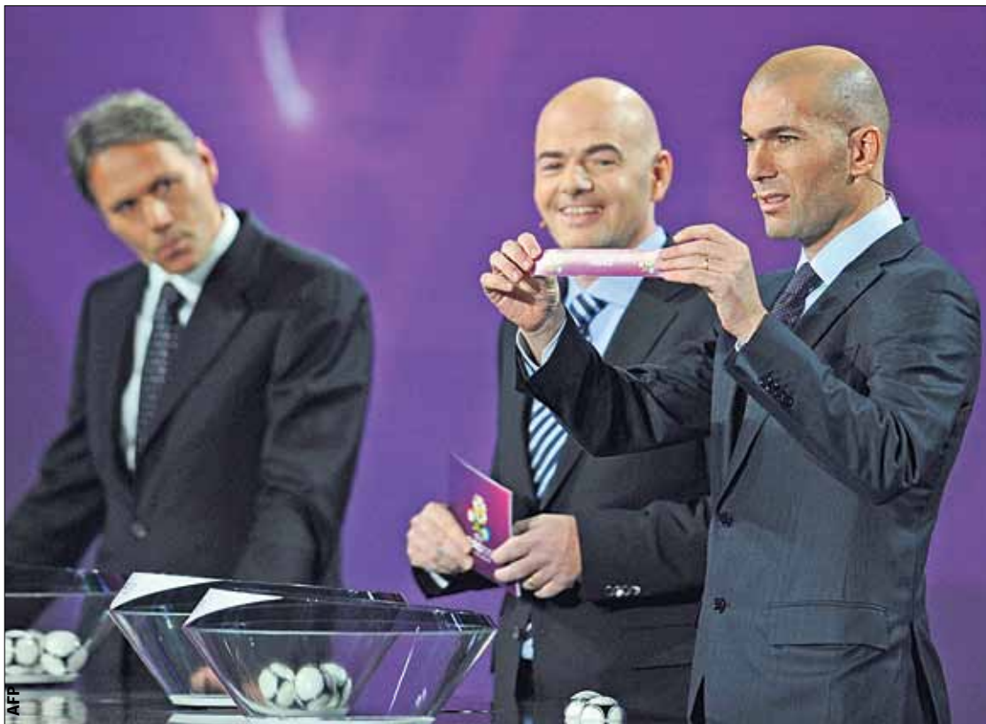
Сюрприз! Ван Бастен и генсек УЕФА Инфантино наблюдают, как Зидан тащит Францию для Украины