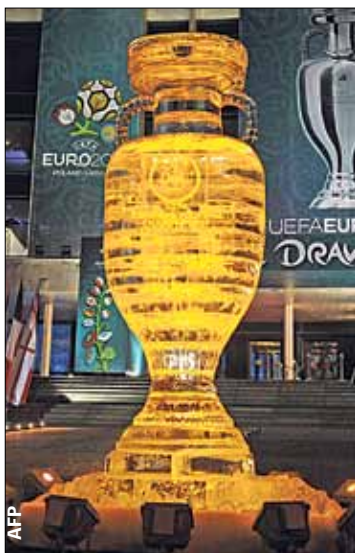
У входа — Кубок Европы из льда