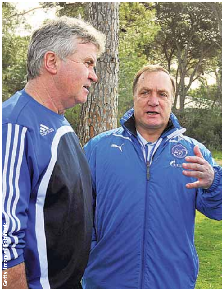
Эстафета. С Хиддинком (слева) была «бронза». Сейчас в сборной Адвокат

Сейчас вместо Хиддинка сборную России возглавля-