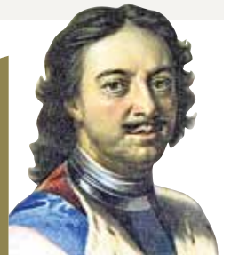
Сборная России по пути Петра I

► Аршавин, который спустя месяц после дебюта за «Арсенал» забил четыре мяча на выезде «Ливерпулю», мог быть шашкистом. Имел юношеский разряд, но не поддался на уговоры «клетчатого» тренера и решил уйти в футбол. Юрий Жирков из бедной семьи рабочего и почтальонши после школы пошел в техникум и выучился на техника-электрика. А уже игроком дубля тамбовского «Спартак» подрабатывал за сельскую команду — за продукты. Сейчас в «Анжи» получает 5,5 млн евро за сезон. А вот вратарь Вячеслав Малафеев признался своим фанатам в «Твиттере», что в юности на спор танцевал стриптиз в мужском клубе. Те в восторге завизжали, что было бы здорово посмотреть! Но кипер поспешил объяснить: «Тогда я не был известен. А сейчас я не готов заниматься подобными вещами».