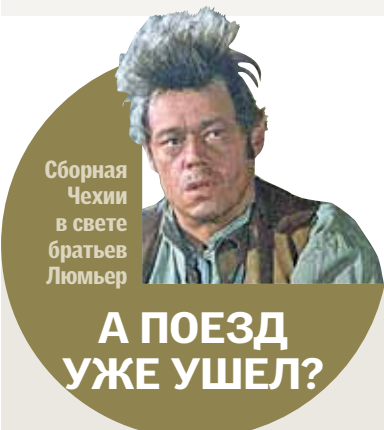
Сборная Чехии в свете братьев Люмьер

► Одна из самых симпатичных команд 2000-х с каждым годом теряла своих лидеров, и ныне из старой гвардии чехов — а новых звезд Бог пока не дал — в строю остались лишь несколько бойцов. Замученный травмами и перепадами в настроении Милан Барош, наконец, нашел свою «тихую гавань» — в «Галатасарае» его бомбардирский талант раскрылся в полной мере. Переживающий вторую молодость «Маленький Моцарт» Томаш Росицки за свое виртуозное обращение с мячом и умение дирижировать игрой команды недавно получил новый контракт в лондонском «Арсенале». А «танкиста» Петра Чеха время не страшит и не старит — голкипер «Челси» сохраняет статус главной чешской звезды. Ему это, в конце концов, по фамилии положено. Из новичков же выделяется (прежде всего — цветом кожи) защитник Теодор Гебре Селассие. Родившийся в моравском Требиचे сын чешки и эфиопа — первый чернокожий футболист в истории сборной.